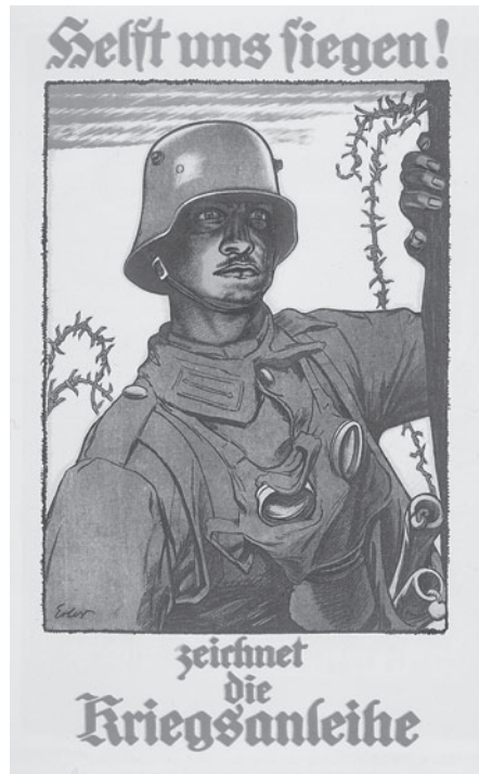
Plakat für die 6. Kriegsanleihe 1917

Überhaupt sollten die schrecklichen Fronterlebnisse möglichst nur gefiltert in der Heimat ankommen. Daher wurde die Feldpost der Soldaten genauso wie