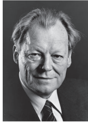
Willy Brandt, 1978

Die Bildung der sozialliberalen Koalition wurde vorbereitet durch die in der FDP umstrittene Zustimmung zur Wahl des SPD-Kandidaten Gustav Heinemann zum Bundespräsidenten (5. März 1969). Programmatisch hatten sich die beiden Parteien seit Mitte der 60er-Jahre mit dem Bekenntnis zu politischen und gesellschaftlichen Reformen angenähert sowie den Bundestagswahlkampf mit dem Motto „ Mehr Demokratie wagen! “ bestritten. Darüber hinaus war klar, dass SPD und FDP nach Möglichkeiten suchten, die Regierungsverantwortung gemeinsam zu übernehmen, da nach den Prinzipien eines echten Parlamentarismus eine Große Koalition nur einen Notbehelf darstellen kann. Mit der Wahl Willy Brandts zum Bundeskanzler am