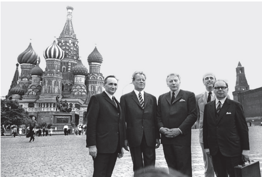
Die „Architekten“ der Neuen Ostpolitik 1970 in Moskau: Egon Bahr (SPD), Willy Brandt (SPD), Walter Scheel (FDP) und zwei deutsche Diplomaten

In einem „Brief zur deutschen Einheit“ erklärte die Bundesregierung, „dass dieser Vertrag nicht im Widerspruch zu dem politischen Ziel der Bundesrepublik Deutschland steht, auf einen Zustand des Friedens hinzuwirken, in dem das deutsche Volk in freier Selbstbestimmung seine Einheit wiedererlangt“. Die sowjetische Regierung nahm diese Stellungnahme offiziell zur Kenntnis, Rechtsgültigkeit im Sinne des Völkerrechts besaß sie allerdings nicht.