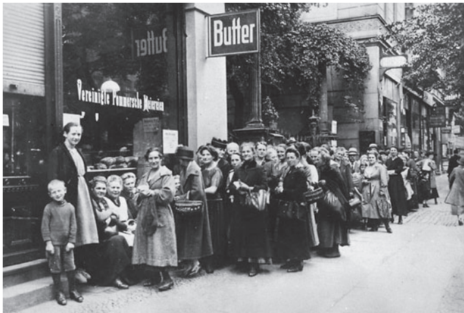
Kinder und Frauen warten in Berlin auf die Zuteilung von Lebensmitteln, 1917

Die schlechte Versorgungslage führte bereits 1915 in manchen Städten zu Hungerkrawallen, Demonstrationen, Streiks und Plünderungen. Auch zwang die existenzielle Notlage viele dazu, auf dem Schwarzmarkt oder bei „Hamsterfahrten“ auf das Land zusätzliche Lebensmittel zu überhöhten Preisen zu besorgen. Diebstahl oder die Fälschung von Lebensmittelkarten nahmen zu. Spätestens seit dem „ Steckrübenwinter “ 1916/17 war der Kriegsalltag großer Teile der deutschen Bevölkerung von Hunger und Mangelernährung bestimmt. Ungefähr 700 000 Menschen – vornehmlich alte und schwache Personen sowie Kinder – starben bis Kriegsende an den Folgen des Hungers.