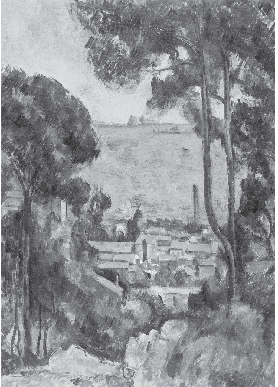
Abb. 1: Paul Cézanne, Blick auf L'Estaque und das Château d'If, 1883–1885