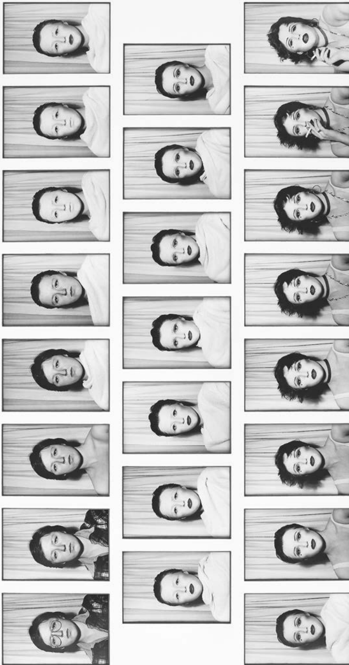
Abb. 2: Cindy Sherman, Untitled #479, 1975