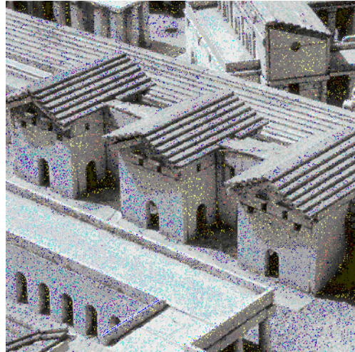
Haus des Hohepriesters Kaiphas, Modell

Gesetz. Insofern war Jesu Kritik am Tempel (Ausreibung der Händler, Mk 11, 15 ff.) damals religiös weitreichender als seine liberale Gesetzesauslegung.