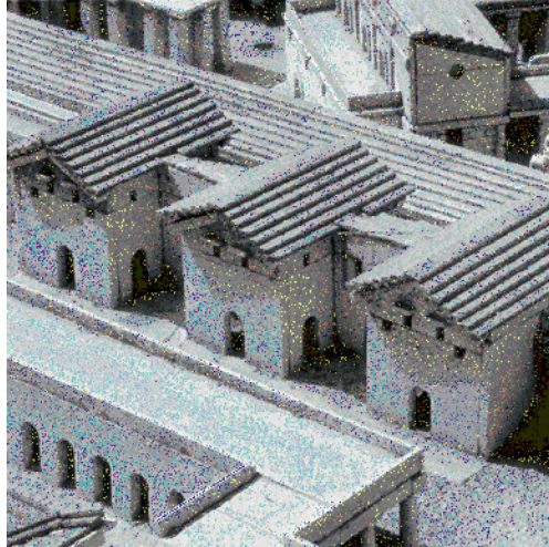
Haus des Hohepriesters Kaiphas, Modell

Gesetz. Insofern war Jesu Kritik am Tempel (Ausreibung der Händler, Mk 11, 15 ff.) damals religiös weitreichender als seine liberale Gesetzesauslegung.