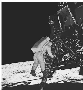
Astronaut Aldrin kurz vor seinem ersten Schritt auf die Mondoberfläche