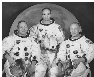
Die Besatzung der Apollo 11 : v.l.n.r.: Neil Armstrong, Michel Collins, Edwin „Buzz“ Aldrin