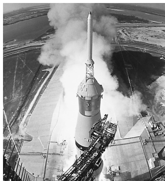
Raumschiff Apollo 11